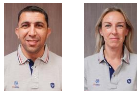
Accès haut niveau