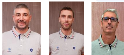
Technico pédagogique, scolaire